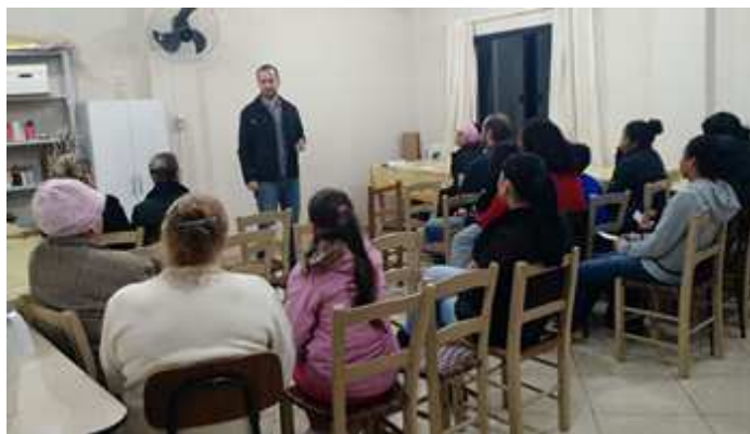
As exposições também acontecem no Núcleo do Bairro Nova Brasília.